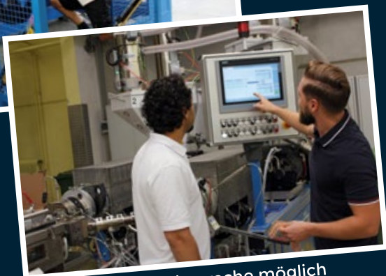
Praktikum nach Absprache möglich